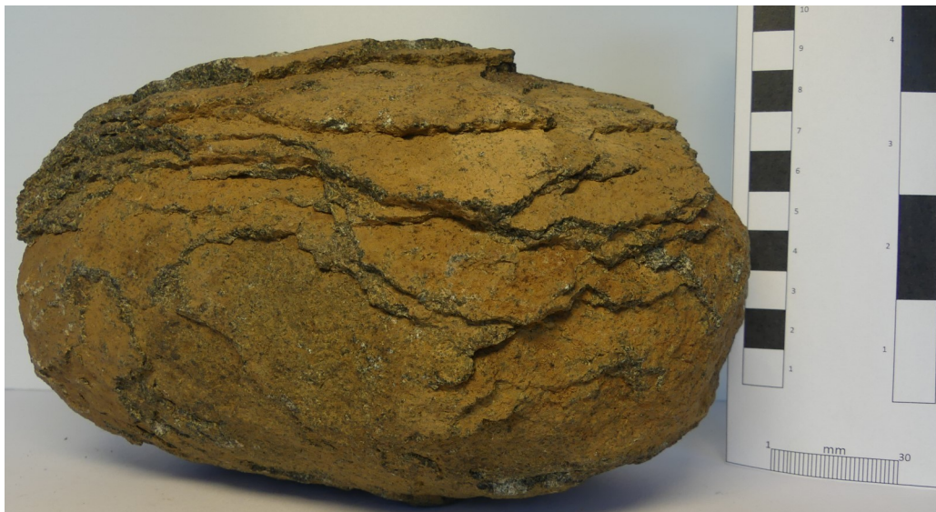
Photographie de l'échantillon