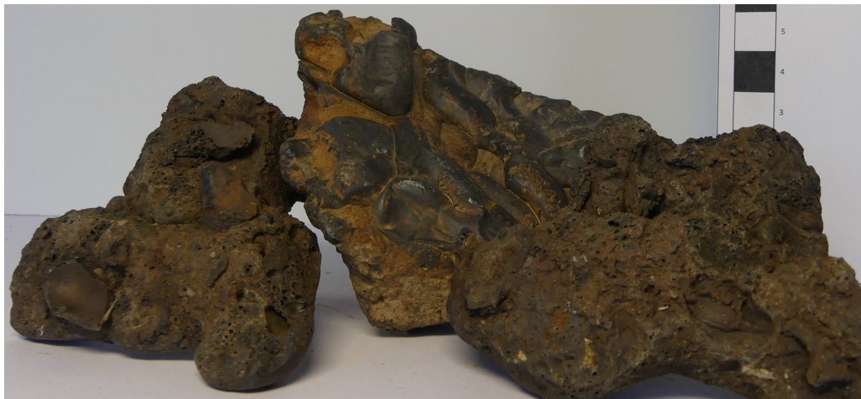
Photographie de l'échantillon (BRGM, 2018)