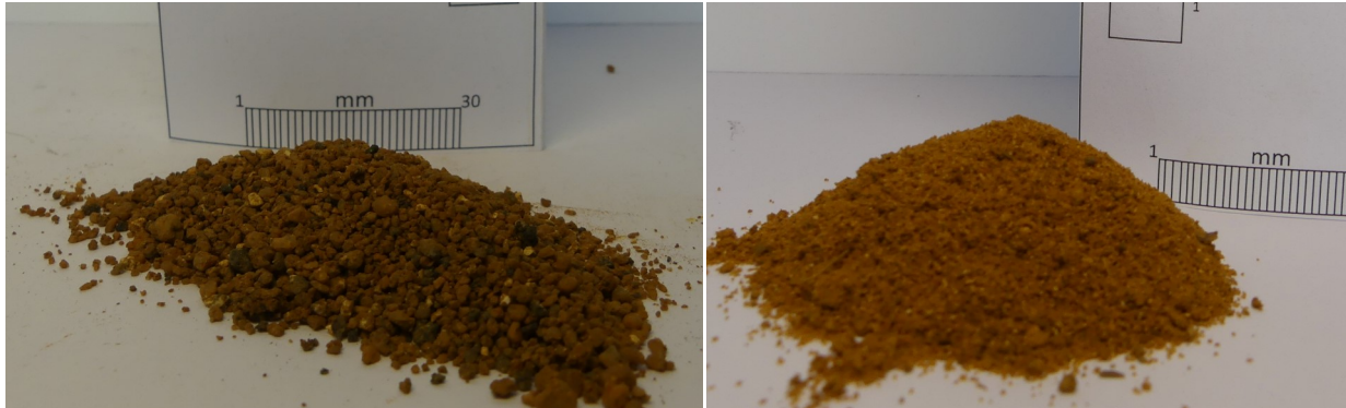
Photographies de l'échantillon (BRGM, 2018)