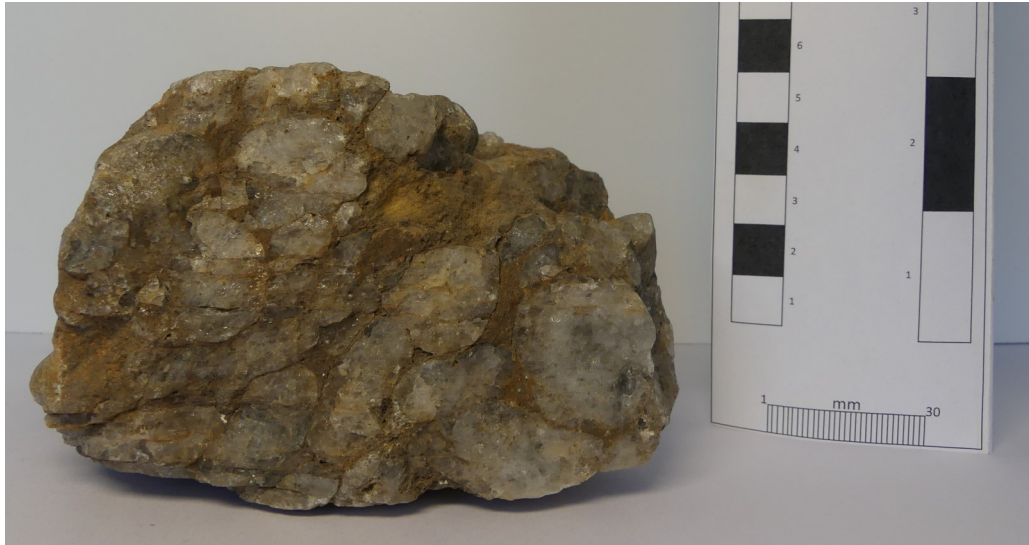
Photographie de l'échantillon (BRGM, 2018)